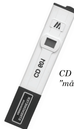
CD 601 ”måske egnet ?”

Og så en lille detalje: 25 poser med 20 ml kalibreringsopløsning koster 200,- kr. (kan også købes stykvis for 20,- kr.). Har du råd til at lade være med at kontrollere dit instrument?